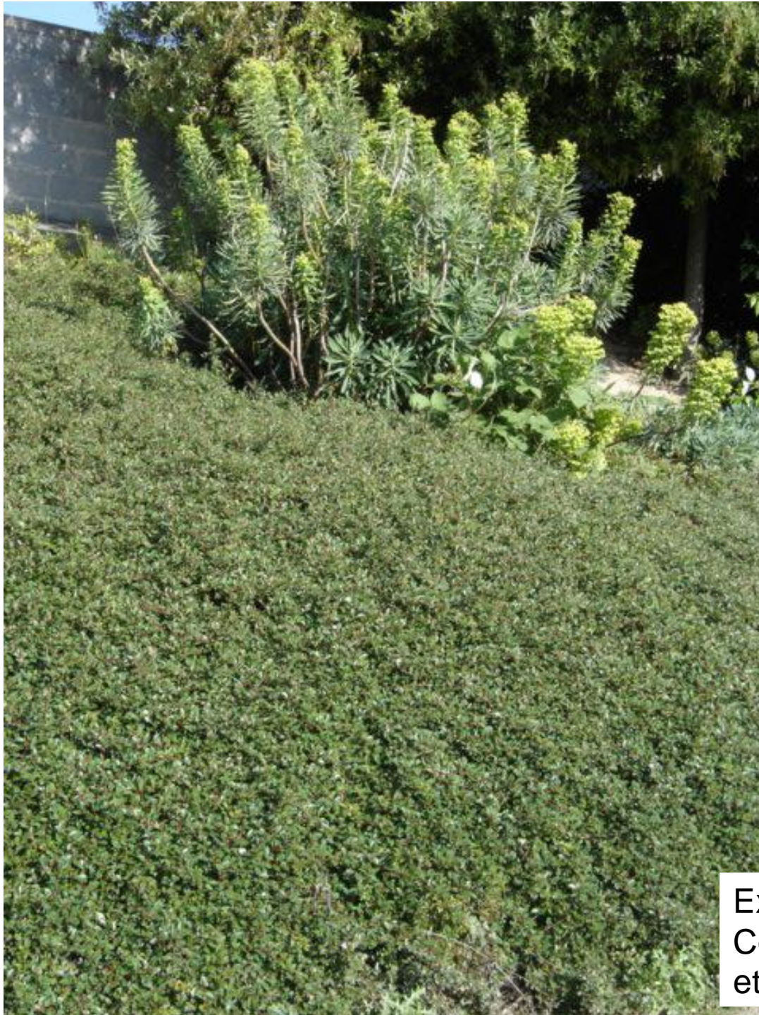
Exemple : Cotoneaster tapissant et euphorbe