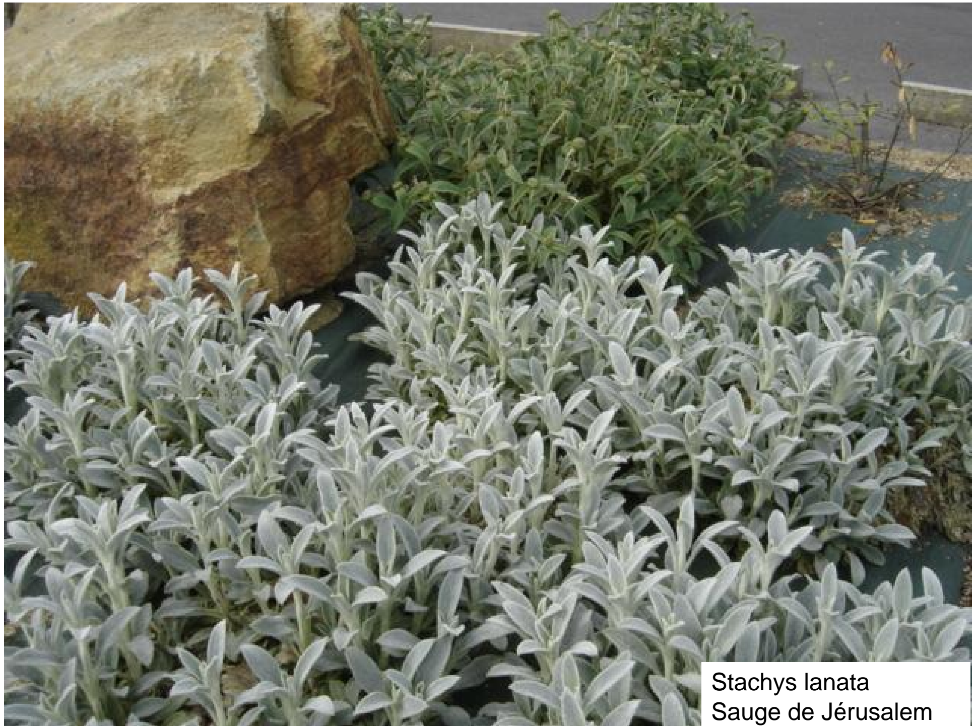
Stachys lanata Sauge de Jérusalem