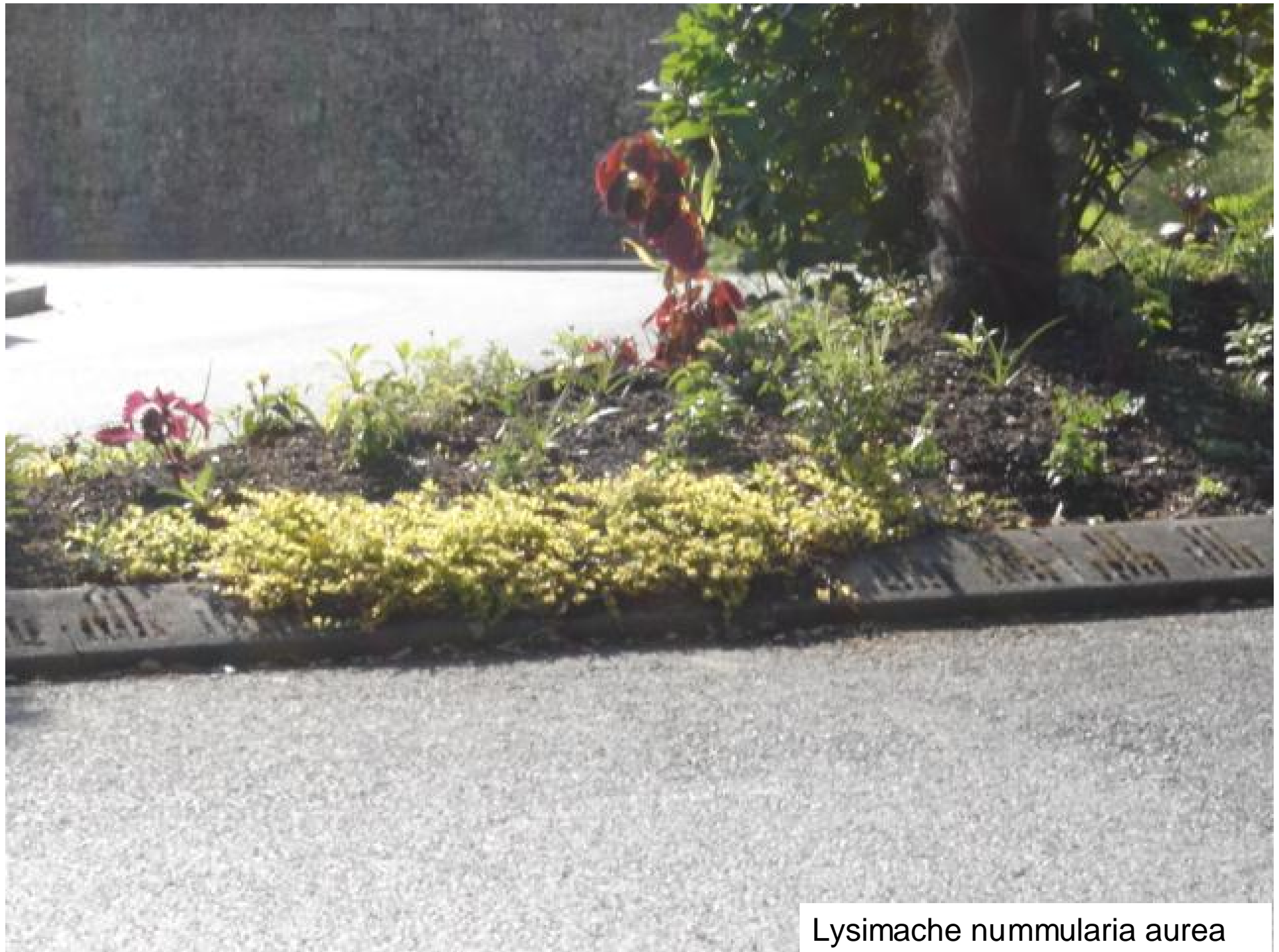
Lysimache nummularia aurea