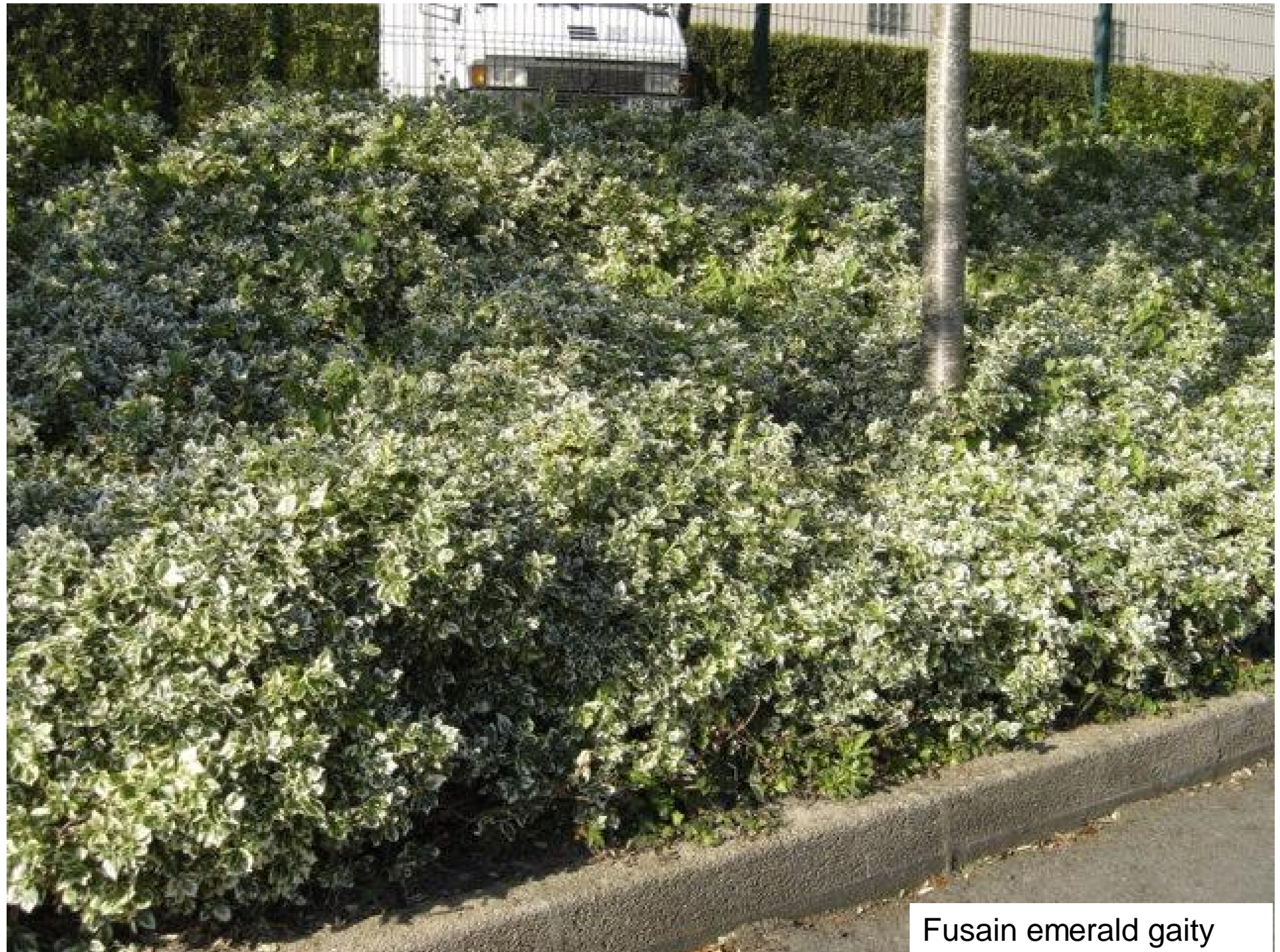
Fusain emerald gaity