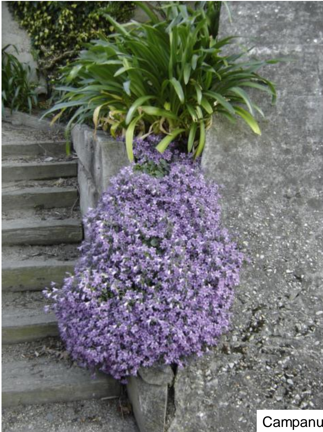
Campanule des murailles