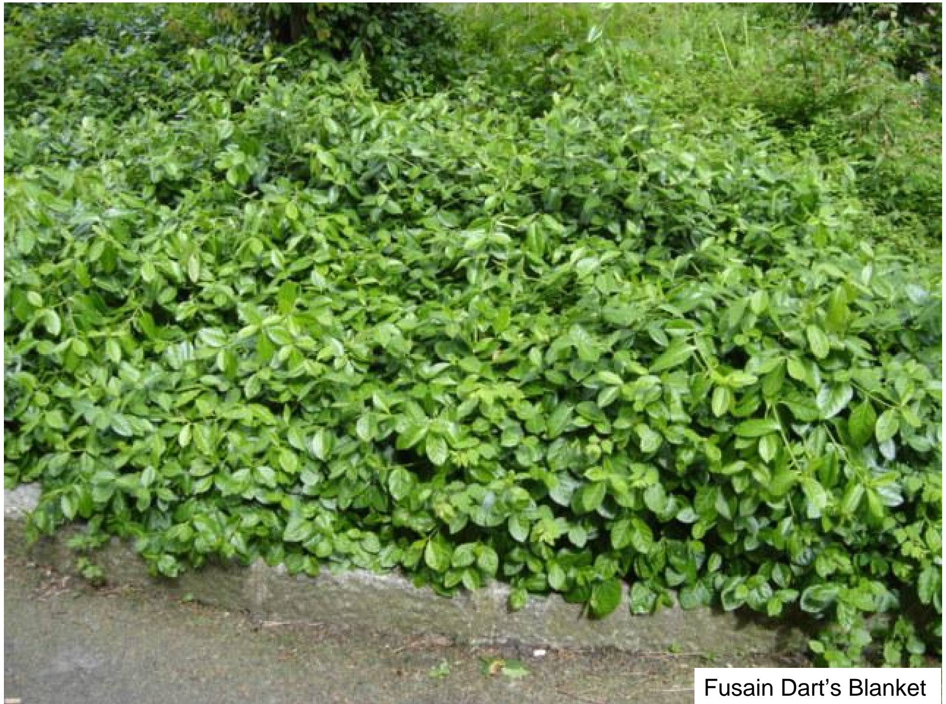
Fusain Dart's Blanket