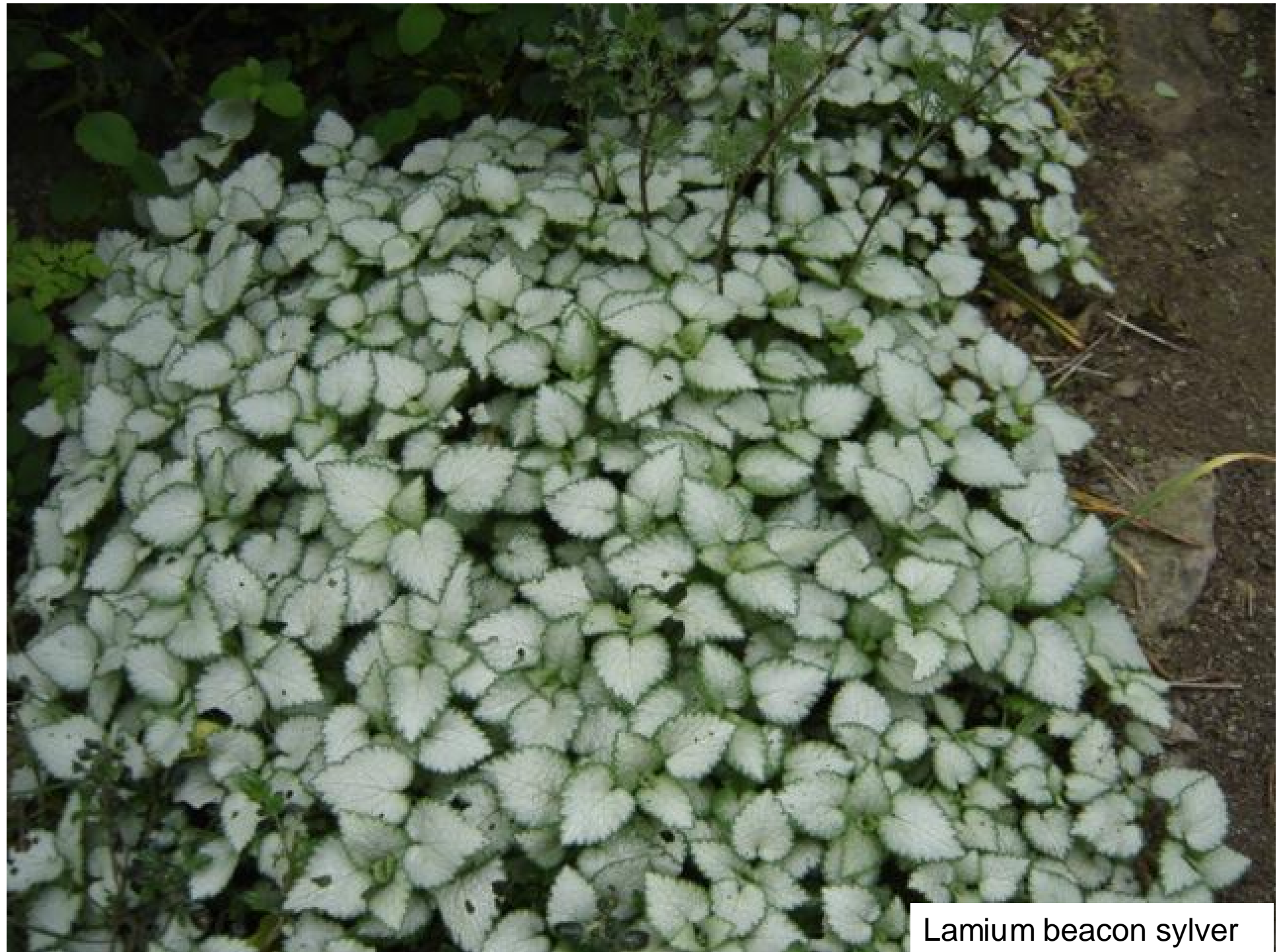
Lamium beacon silver