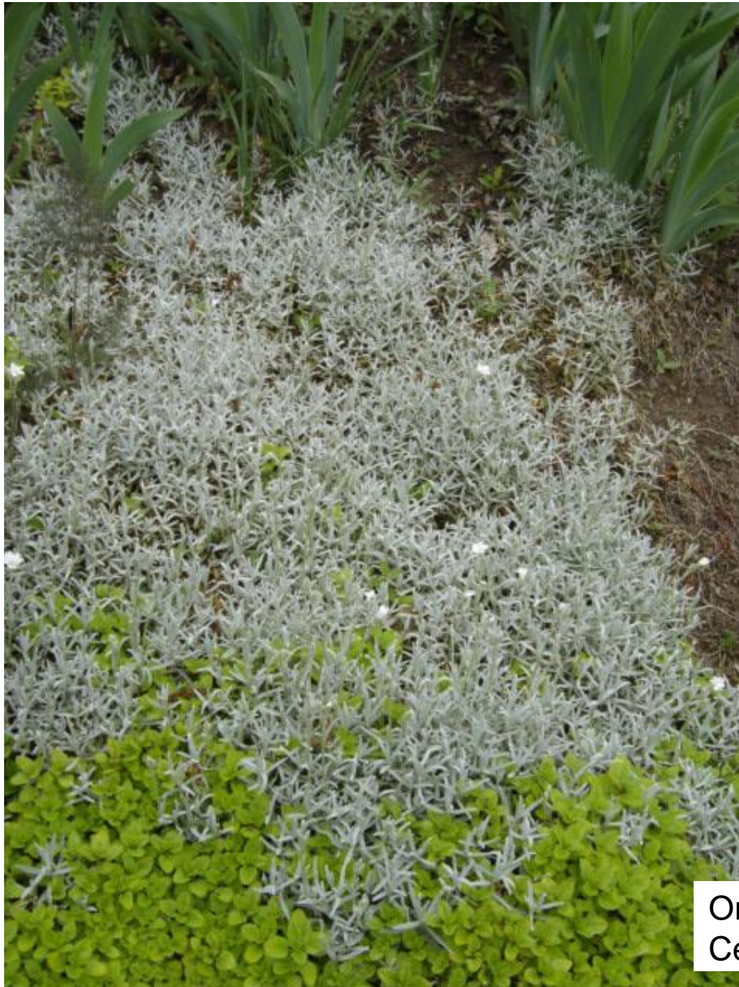
Origan (devant) Ceraiste (derrière)