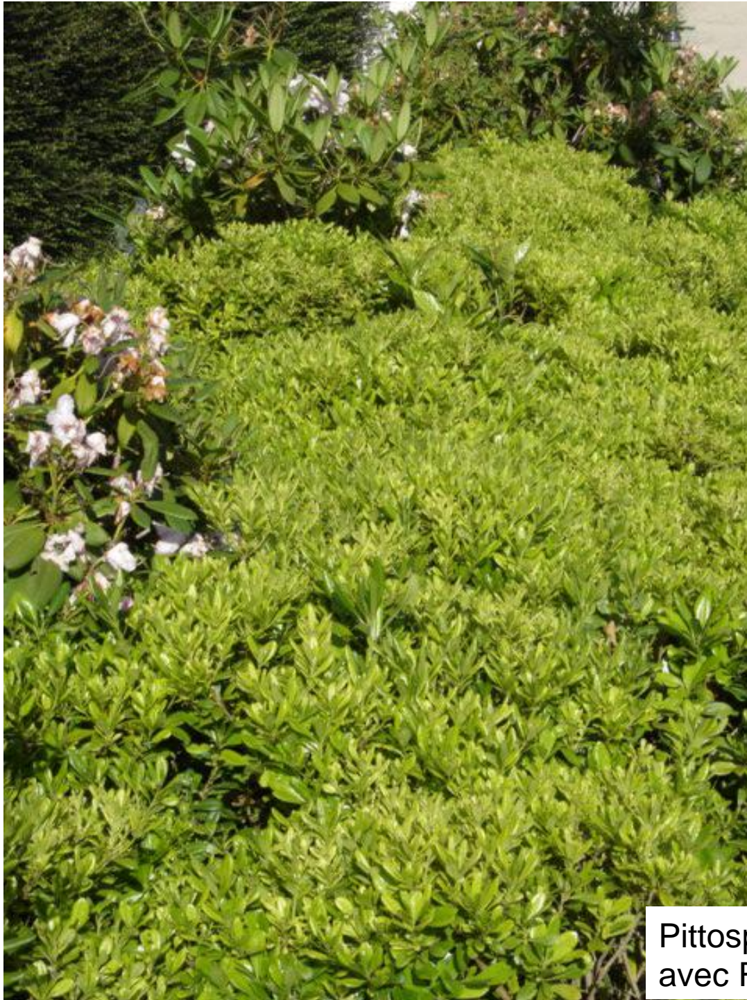
Pittosporum tobira nana avec Rhododendron