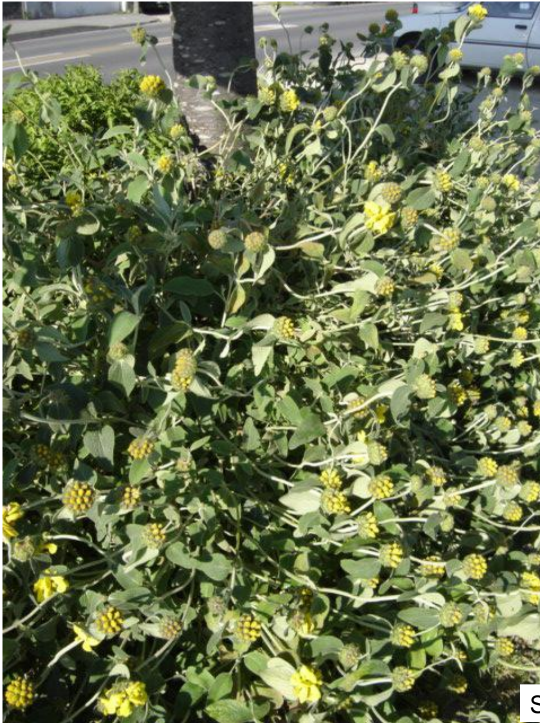
Sauge de Jérusalem