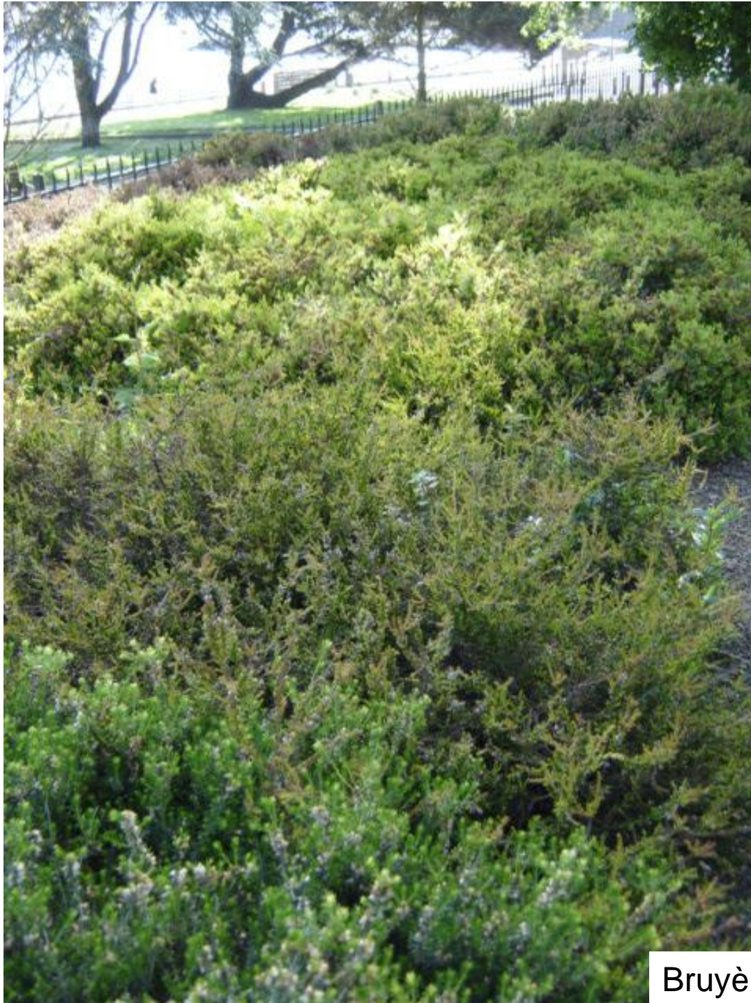
Bruyère : callune, erica