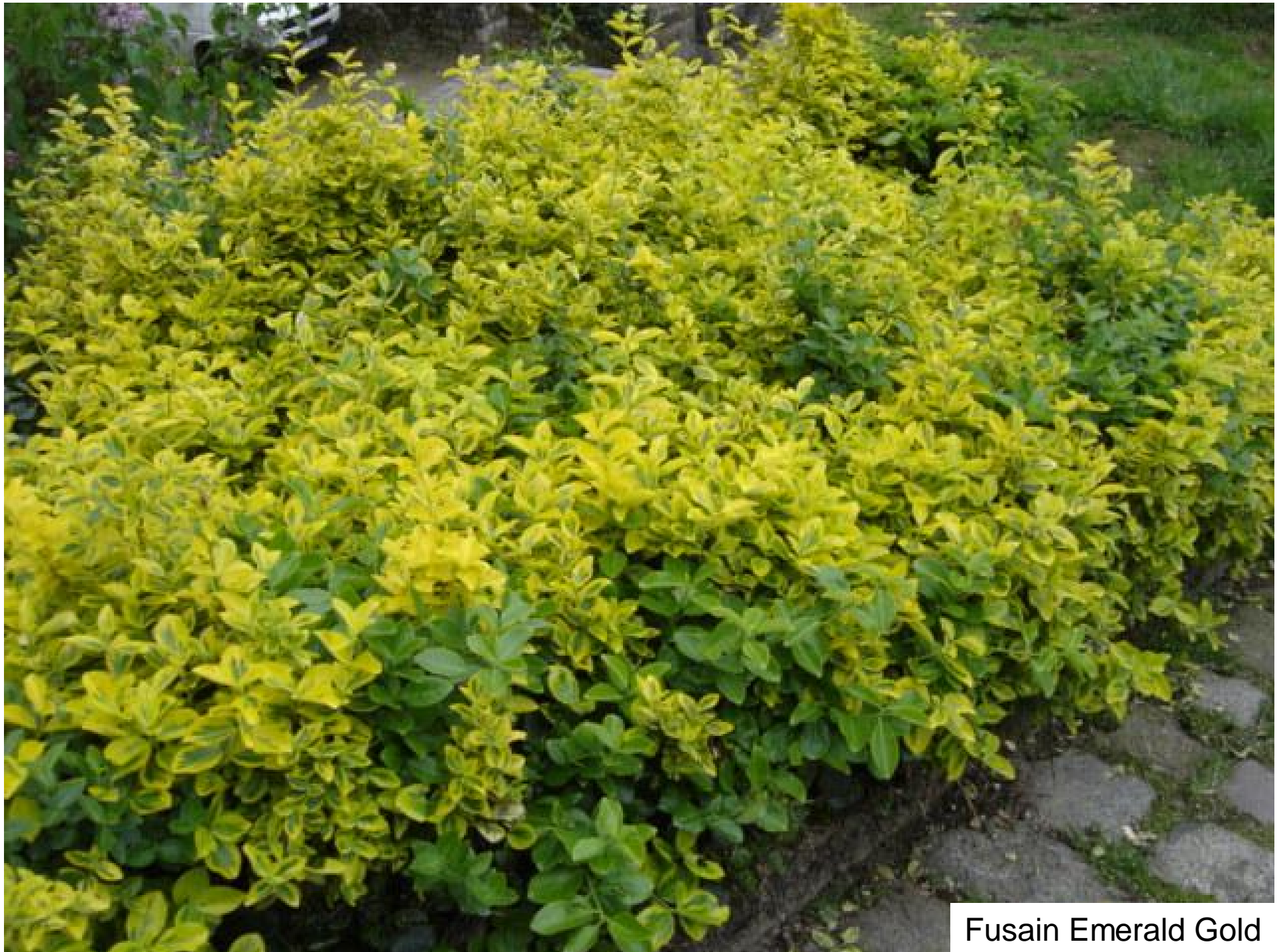
Fusain Emerald Gold