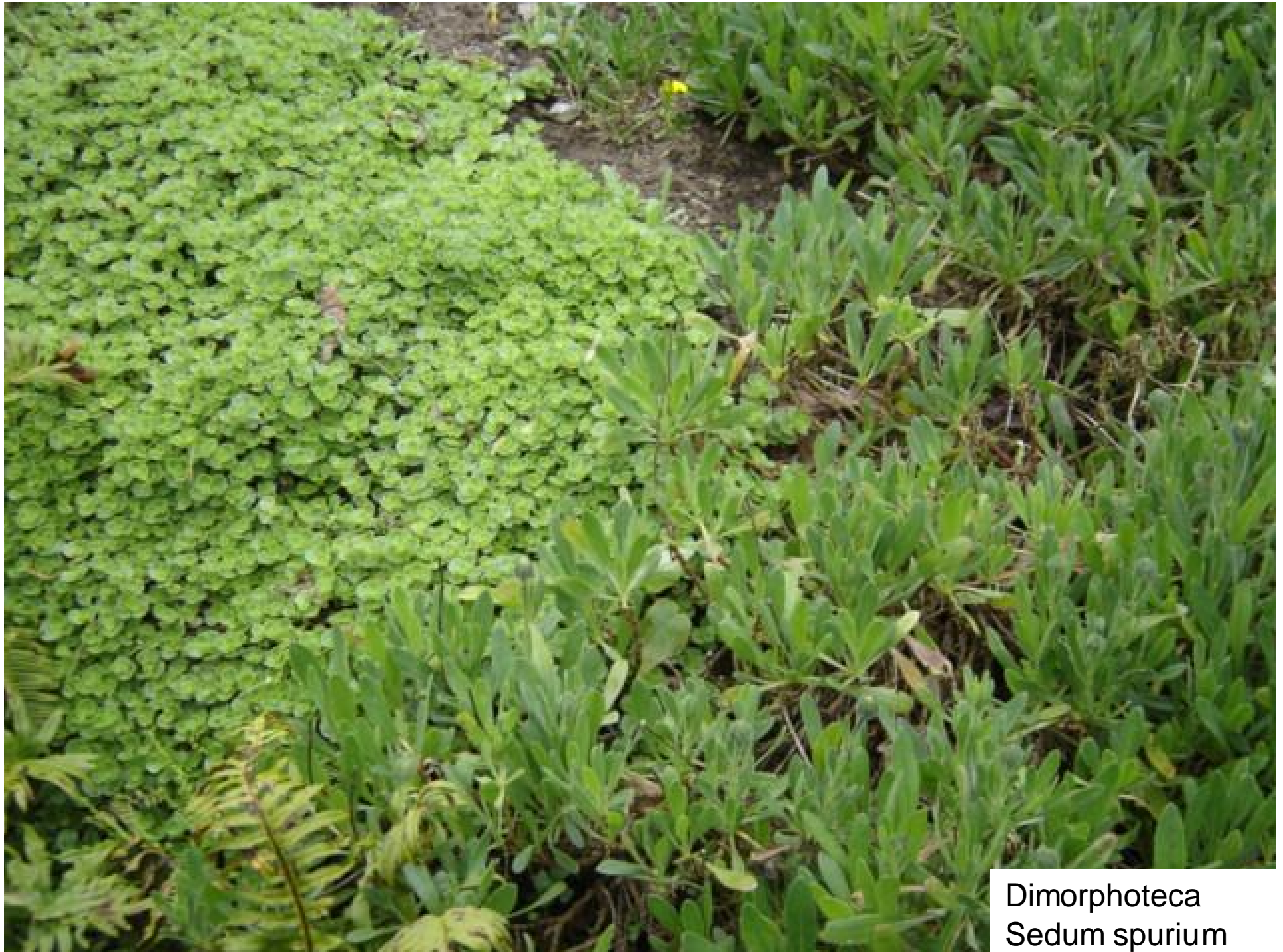
Dimorphoteca Sedum spurium