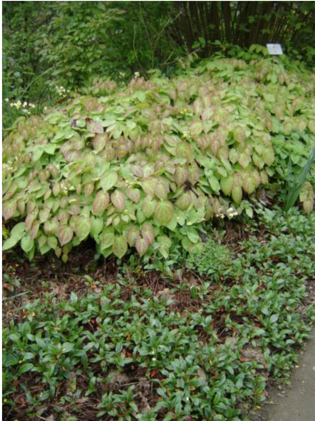
Polygonum affine Epimedium